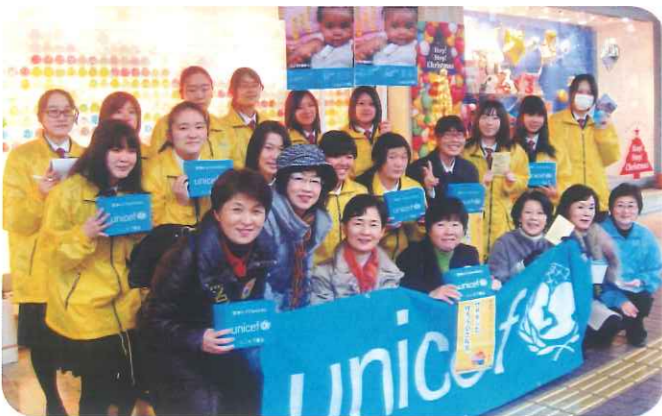
慶誠高校の生徒さんと共に