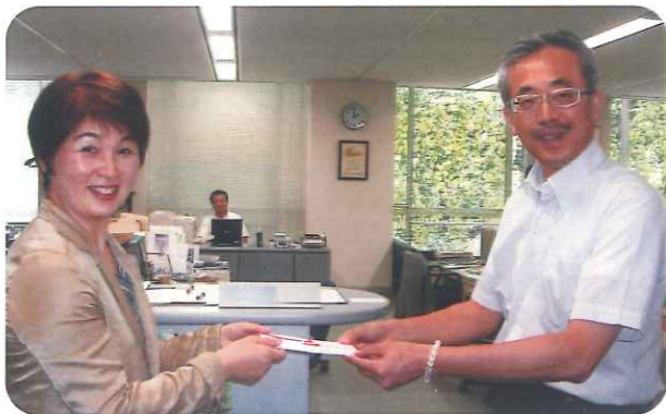
クラブ会員からの募金を「7.12九州北部豪雨災害救援金」へ寄付。