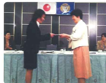
理学療法士を目指して勉強中