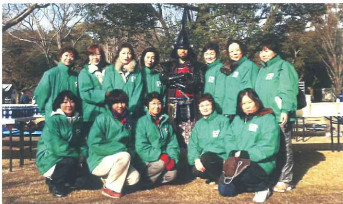
事前受付事務2名、当日スタッフ12名参加