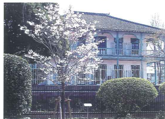
「たった1本の桜だからこそジェーンズ邸を訪れる方達のいやしになっている」と館長さんからお言葉をちょうだいしました。