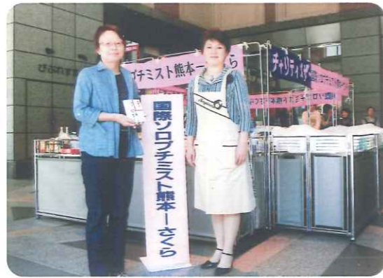
バザー益金の一部をふれあいワークに贈呈。