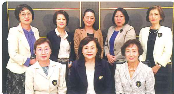
一年間お疲れ様でした。